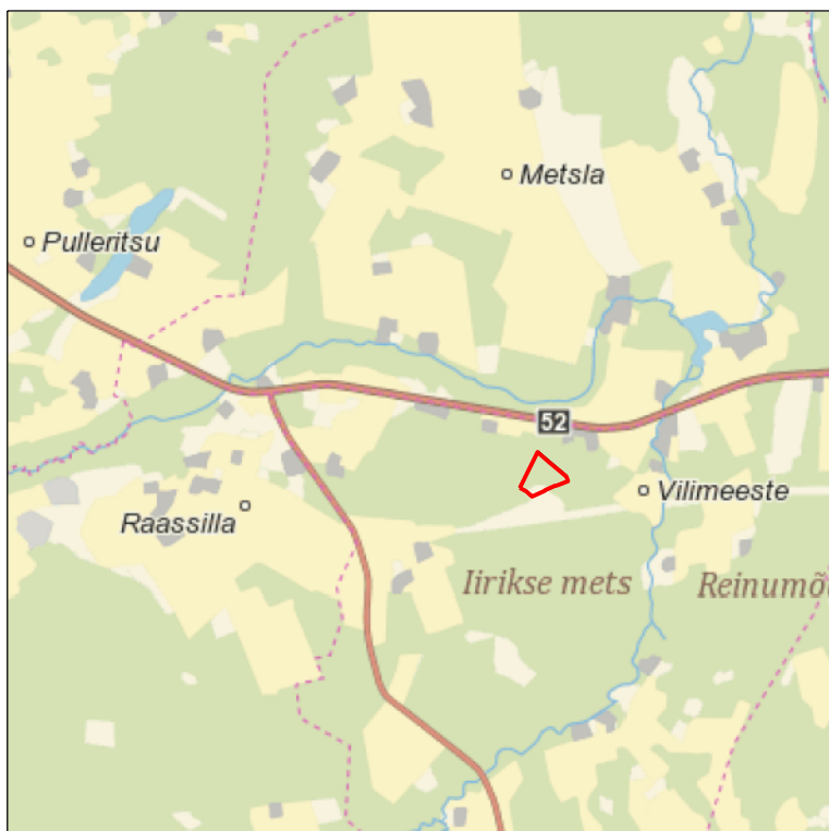
Kaardileht nr 5431 Mustla